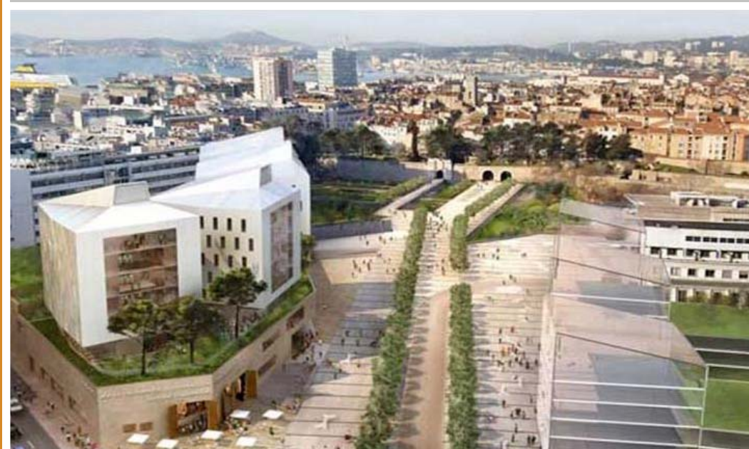
Projet du nouveau pôle universitaire centre ville – Maître d'ouvrage TPM - Agence d'architectes Nicolas Michelin et Associés (ANMA).

Des rapprochements en cours avec des laboratoires extra-départementaux