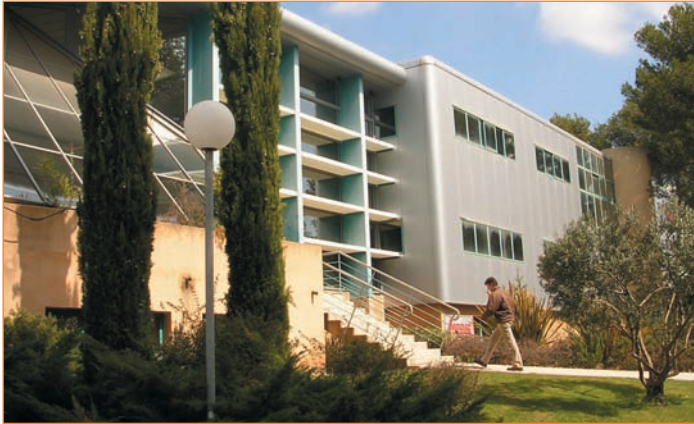
Parc d'activités de Signes.

L'accroissement significatif des fonctions métropolitaines supérieures dans l'aire toulonnaise passe par le développement des filières d'excellence économiques spécifiques au territoire, une meilleure inscription dans les réseaux régionaux de compétitivité économique, et aussi un rattrapage dans les domaines où subsiste un retard important.